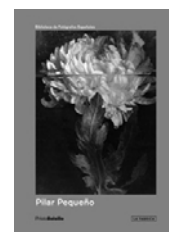
Pilar Pequeño Colección Photobolsillo n° 12 La Fábrica. Madrid 2007 Textos: Luis Revenga. 2ª edición revisada. Venta en librerías.