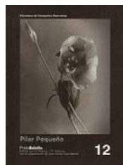
Pilar Pequeño Colección PhotoBolsillo n° 12 La Fábrica. Madrid. 1999 Textos: Luis Revenga, María Ángeles Sánchez. Edición agotada.