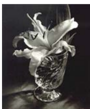
La Samanna. impressions La Samanna. Saint Martin. French West Indies. 2007 Textos: Luis Revenga.