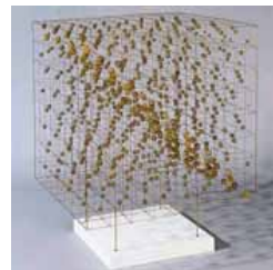
Günter Haese- Würfel, 2005.