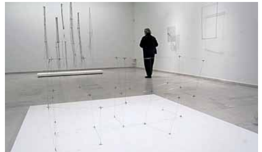
La muestra se inauguró este miércoles y permanecerá hasta enero.

El comisario de la muestra detalla además que las obras son "muy heterogéneas" en cuanto a formas y materiales, y que todas "ponen en juego de forma deliberadamente 'estética', es decir, sensible, conceptos como levedad, ausencia o fugacidad".