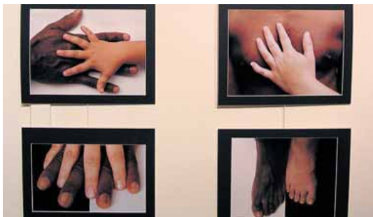
Primer premio de fotografía "Triartes por la Igualdad".

Los materiales presentados por los concursantes serán proyectados además en la Fiestografía del viernes 14.